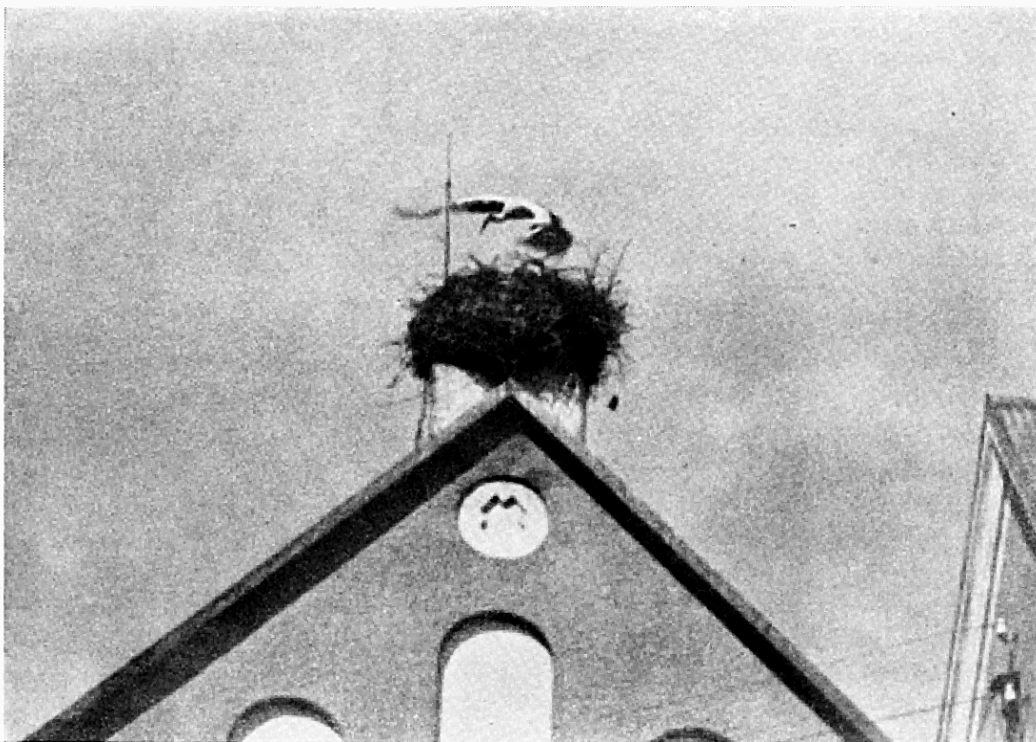
Stork lyfter från boet.